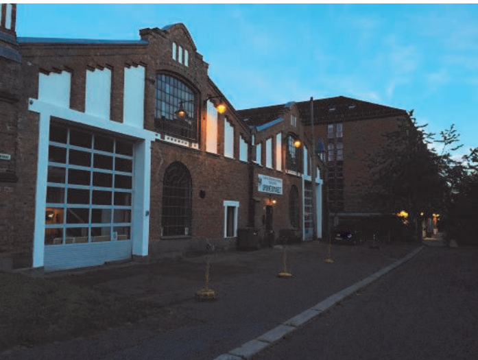
Sommeren 2014 fikk museet endelig montert nye utelamper som gir museets fremside en hyggeligere fremtoning på kveldstid.