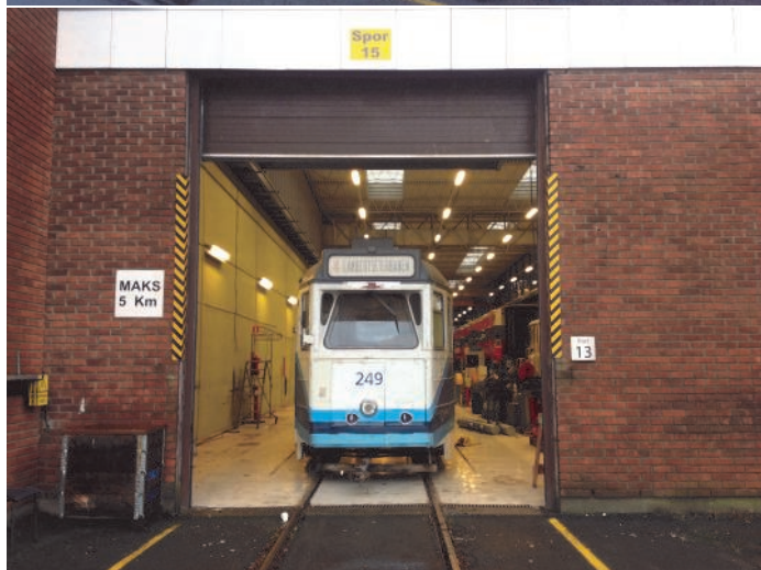
Vogn 249 før, under og etter transport til Mantena på Grorud for relakkering høsten 2014.