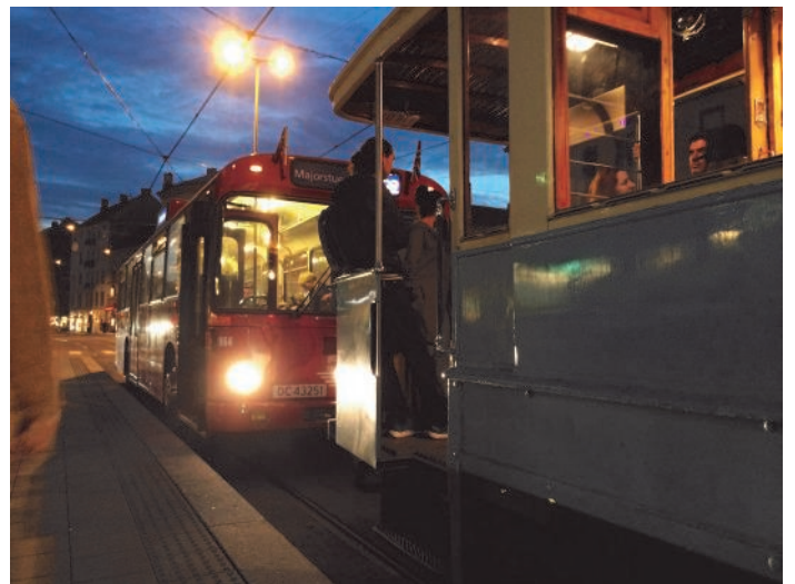
Under Kulturnatta- 70/647 kjørte mellom Stortorvet og Majorstua mens OS 964 gikk i skyttel mellom museet og holdeplassen i Majorstukrysset.

Den årlige Kulturnatten ble arrangert 12. september. Som vanlig stilte LTF med åpent museum, med veterantrikk mellom Stortorvet og Majorstua og med skyttelbuss mellom trikkeholdeplassen og museet. På museet ble det holdt kontinuerlig omvisninger. Kulturnatten er en glimrende anledning til å gjøre museet og LTFs virksomhet kjent. Selv om kjøring og museum er gratis, og dermed ikke gir noen umiddelbar økonomisk gevinst, er det med på å gjøre museet kjent og kanskje et mål for senere besøk.