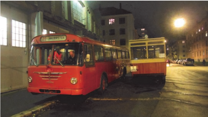
Kjærlig møte mellom busser med 45 års aldersforskjell, EB 2 fra 1924 og OS 835 fra 1969. Ved årsskiftet stod begge utstilt i museet.

Det har vært få endringer på vognplassering i museet. Ekebergbanebuss nr. 2 er flyttet til forrest på spor 20, mens Oslo Sporveiers A-15835 har erstattet NSB-buss D-14849 på samme spor. I tillegg er sporvogn 183 blitt erstattet av vogn 170. dette betyr at det igjen er mulig å vise fram en gullfisk også innvendig.