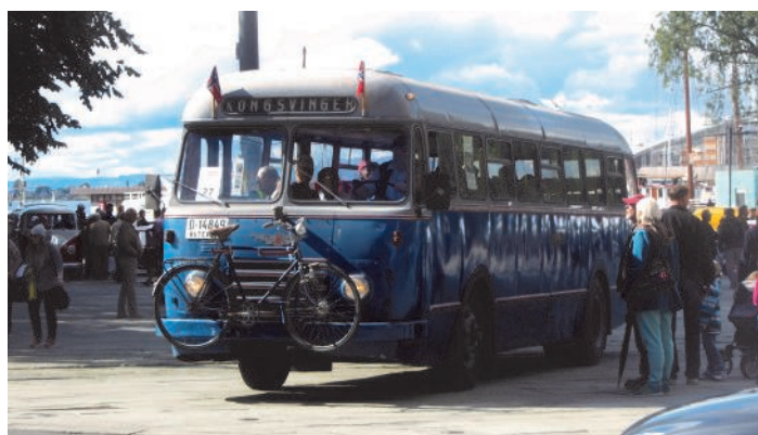
NSB-bussen var spesialbestilt av teknisk museum for anledningen.

28. august markerte Norsk teknisk museum sitt 100 årsjubileum. I den anledning ble det arrangert en kortesje med kjøretøyer fra Rådhusplassen og opp til museet på Kjelsås. LTF stilte med to busser, NSB D-14849 fra 1955 og OS/Sporveisbussenes 793. Bussene var plukket ut etter ønske fra Teknisk museum. De var åpne for publikum som ønsket å bli med opp til arrangementet på Kjelsås. Arrangementet på Kjelsås trakk mye folk, og ikke få var også bortom og så på LTFs busser som var oppstilt på parkeringsplassen ved museet så lenge festlighetene varte.