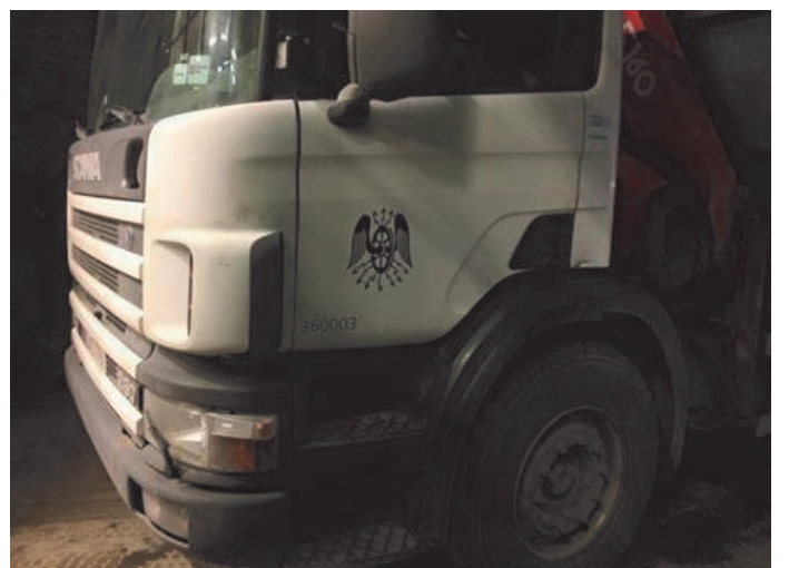
På lastebilen har LTF-ørna kommet på plass.

I 2014 overtok vi også lastebil med internummer 360003 fra Sporveien. Dette er en Scania fra 1999.