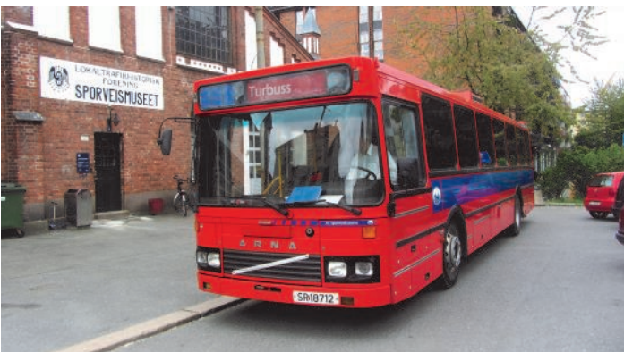
OS 793 er blitt en av slietene på Bussringen.

I 2014 ble vognparken utvidet med ytterligere en buss. Det dreier seg om SBC reg. nr. DH 48185. Bussen er levert SBC fra Arna Bruk i 1995 hvor den var i drift fram til 2002. Deretter tjenestegjorde den hos TrønderBilene AS før en gruppe LTF-medlemmer kjøpte den tilbake og ga den til foreningen. SBC hadde i alt 52 busser av liknende type i drift., 18 med tilsvarende karosseri.