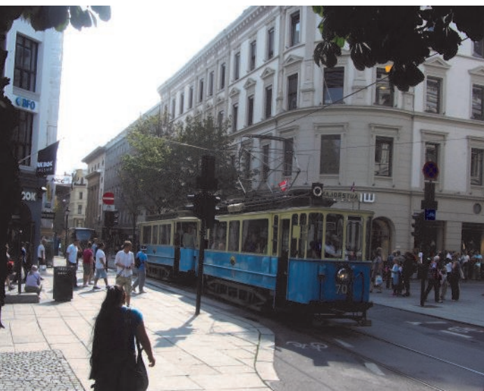
SS-tog 70 og 647 fra 1913 fraktet nesten 17.000 i 2014! En imponerende innsats ble lagt ned gjennom hele året til glede for Oslos befolkning og byens turister.

I året for øvrig hadde vi en rekke utleieoppdrag for vognene som ga foreningen viktige økonomiske bidrag. Særlig omfattende var kjøringen ifm. platelanseringen til Jarle Bernhoft (Islander) i april 2014.