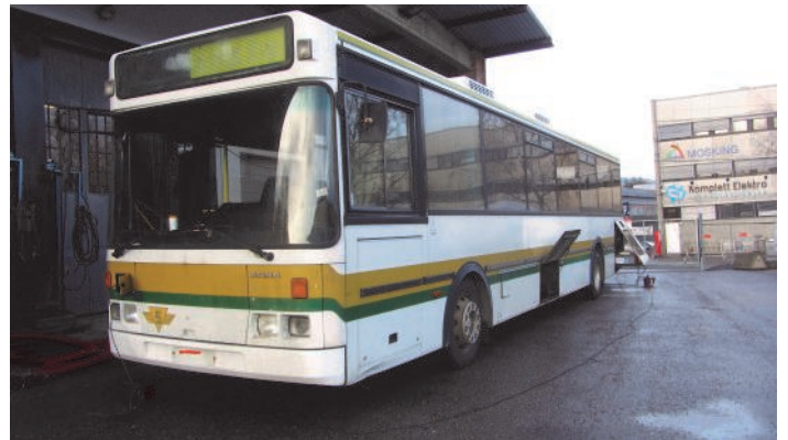
SBC mottok gjennom årene et meget stort antall Mercedes-busser med Arna Karosseri. Selv om ikke SBC 74 er den mest typiske versjonen, står den like fullt som et godt eksempel på epoken da norske bussfabrikker fortsatt var hovedleverandør av kjøretøy til Oslo og Akershus. Modellen representerer dessuten overgangen til det som skulle bli lavgulvsbusser.

LTF overtok denne bussen da vi ønsket å bevare en typisk langrutevogn fra 1990-tallet. Den er i svært god teknisk forfatning, og karosseriet er med unntak av litt rust bak likeledes i god stand.