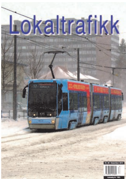
Lokaltrafikk #89 fra desember 2014.

Det er kommet ut i alt fire Lokaltrafikk i 2014. Vi mener bladet har en god kvalitet med artikler og nyhetsstoff som interesserer et bredt publikum. Vi vet at bladet leses også utenfor foreningens medlemsrekker, blant annet i trafikkselskapene. Det er kommet mye gode tilbakemeldinger, ikke minst de historiske artiklene om kollektivtrafikken i Oslo.