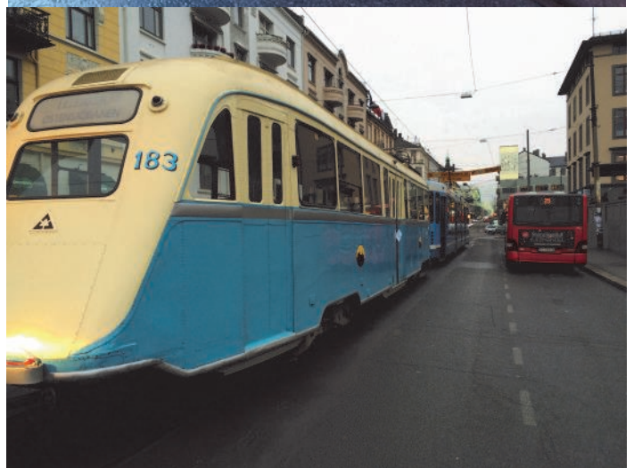
En kommer og en går. 183 og 170 byttet høsten 2014 plass med få dagers mellomrom. 183 ble trukket til Grefsen mens 170 kom på lastebil fra Ulven.