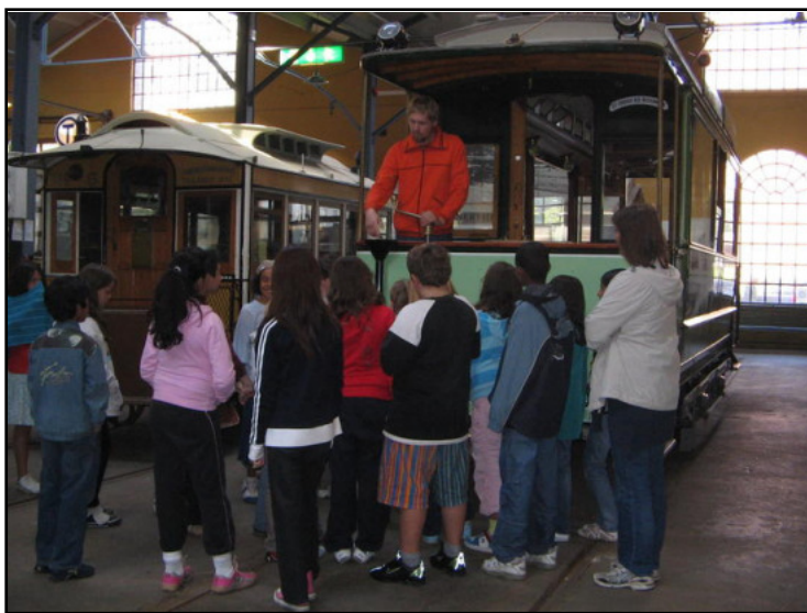
Over og til høyre: