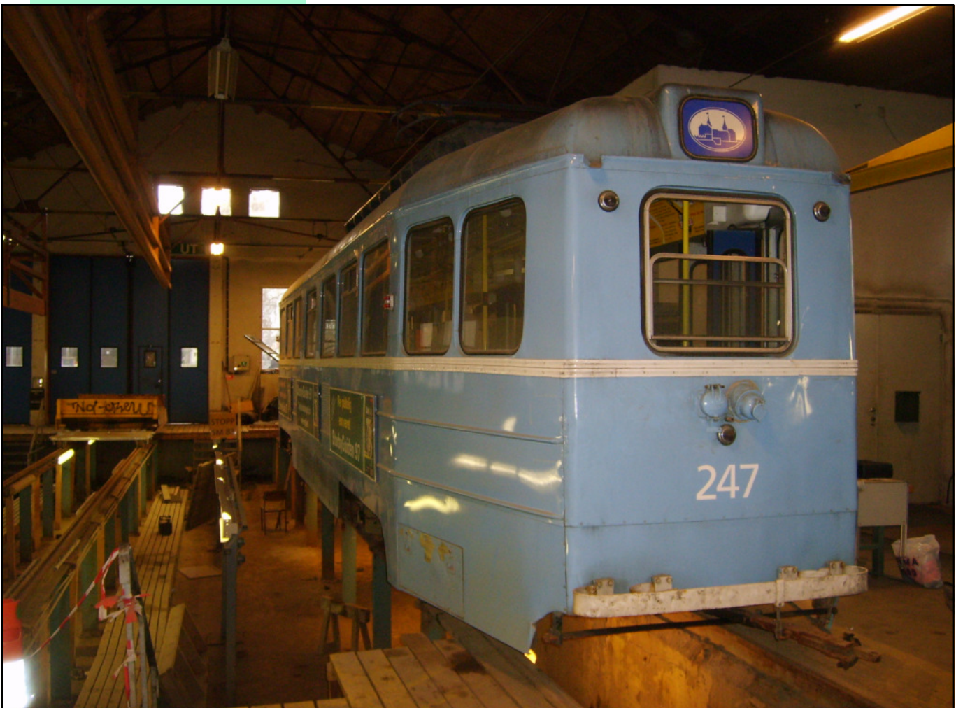
Vogn 247 vel fremme i Holtet vognhall der den står over grav.