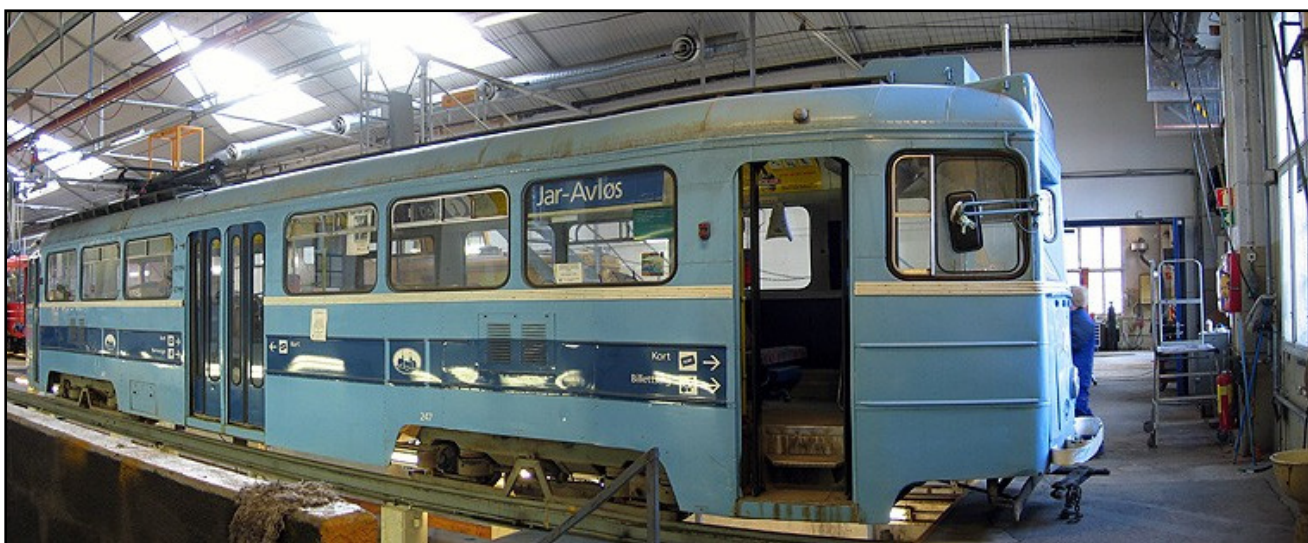
Høkavogn 247 på Avløs verksted.

Dette er en buss av typen MAN SL 200, som gikk i Oslo på 80- og 90-tallet. Bussen har til nå stått på Vinterbro, men det er vedtatt å restaurere denne. Første del av arbeidet skjer på Avløs verksted, og omfatter plateskift, skift av stendere/utbærere osv. slik at bussen kan registreres, samt lakkering. Prosjektet styres av foreningens bussgruppe.