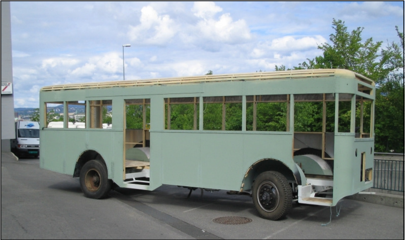
A-177 klar til transport fra Postgarasjen til Vinterbro i