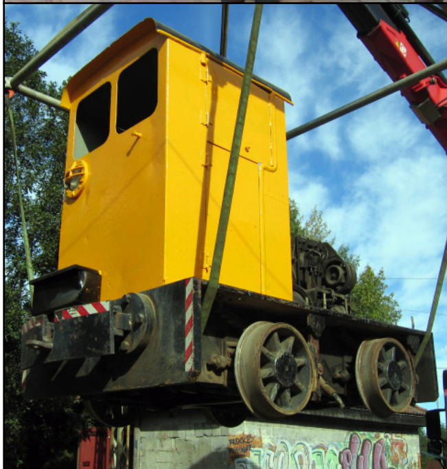
Skiftelokomotivet "Tøffe" ankommer Vinterbro 8. september 2006.

SS-vogn 87 er gjort driftsklar, og brukes til passasjertrafikk på Vinterbro.