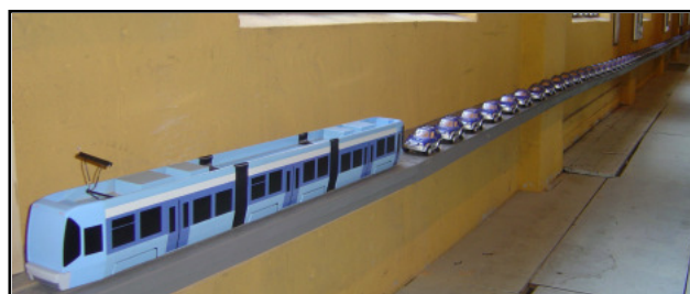
Nye utstillinger i Sporveismuseet.