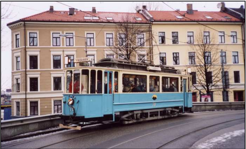
SS-vogn 70 er ikke i LTFs vognpark; den tilhører Sporveien. Her krysses Geitabru mot Oslo hospital på medlemsturen til LTF 14. desember 2003.