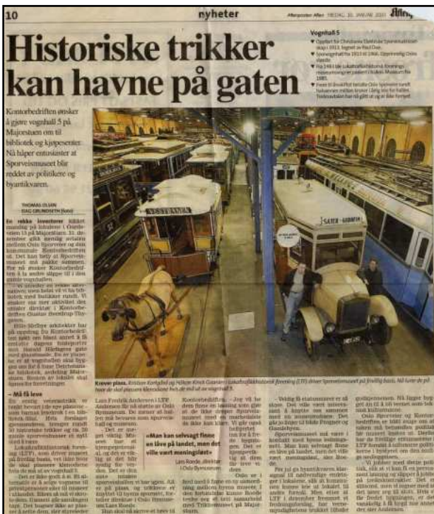
(Faksimile fra Aftenposten Aften, 10. januar 2003)

10. januar ble Sporveismuseet omtalt i et helsides oppslag i Aftenposten Aften i forbindelse at museet risikerte å bli nedlagt. Deretter fulgte flere leserinnlegg med støtte til videre drift av museet.