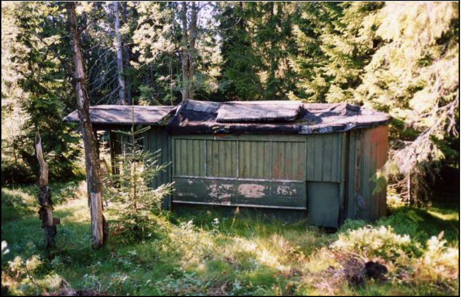
Ved Ørfiske i Nordmarka står denne hestesporvognshytta fra 1875 av type Stephenson i skogbrynet.