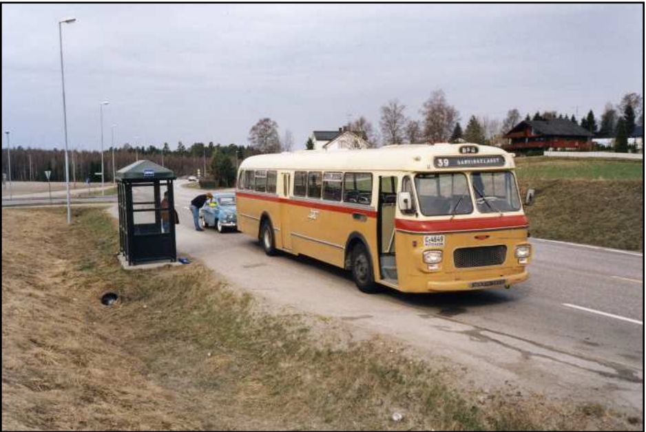
BFB-buss 49 deltok ved det transporthistoriske treffet i Trøgstad 26. april. Her tar man en pause i Spydeberg.